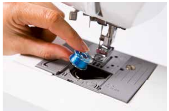
Einfach eine volle Spule einsetzen, schon sind Sie startbereit