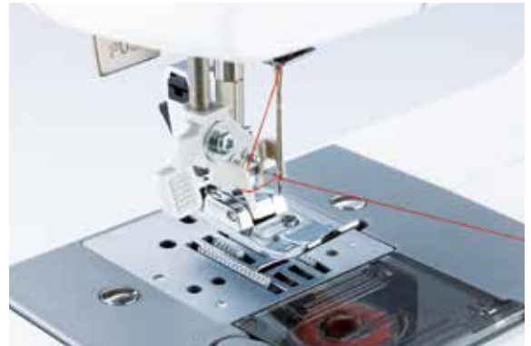
Einfaches automatisches Einfädeln