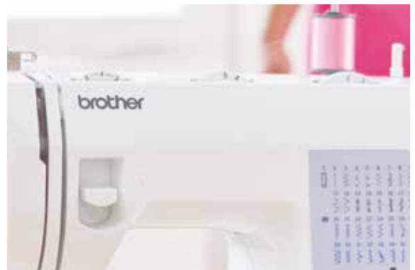
Stichlänge + Stichbreite einstellbar